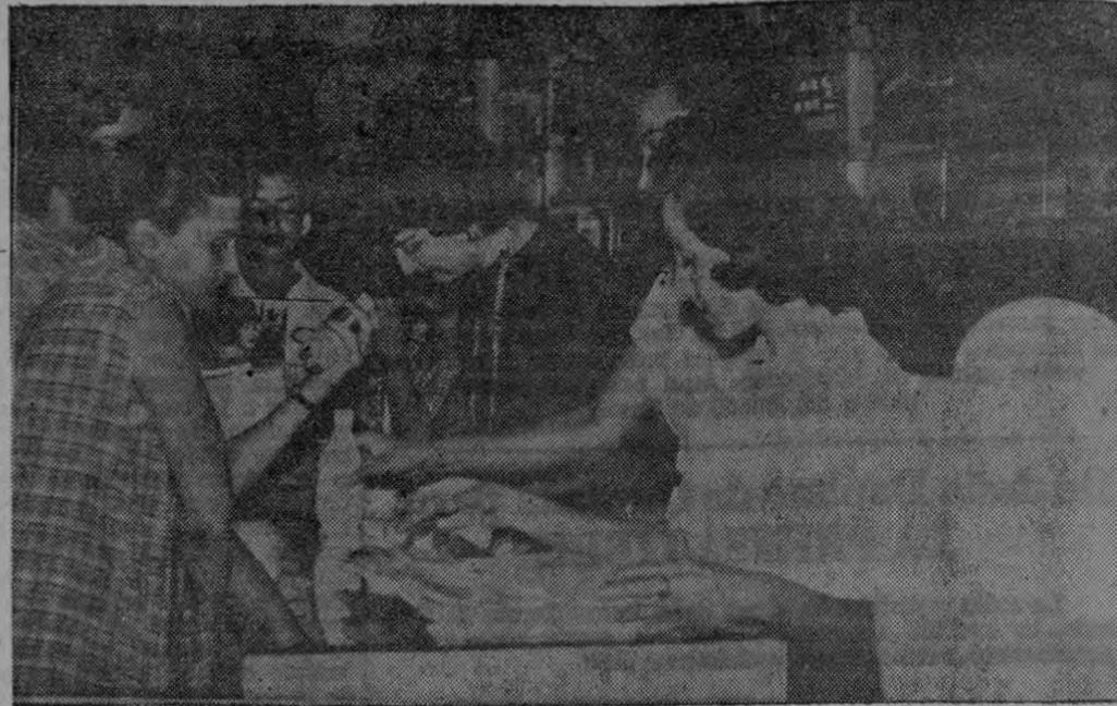
En este grabado Miss Coty muestra los productos Coty a las damas, los aplica, contesta sus preguntas y luego de las explicaciones orales realiza magníficas demostraciones de maquillaje.